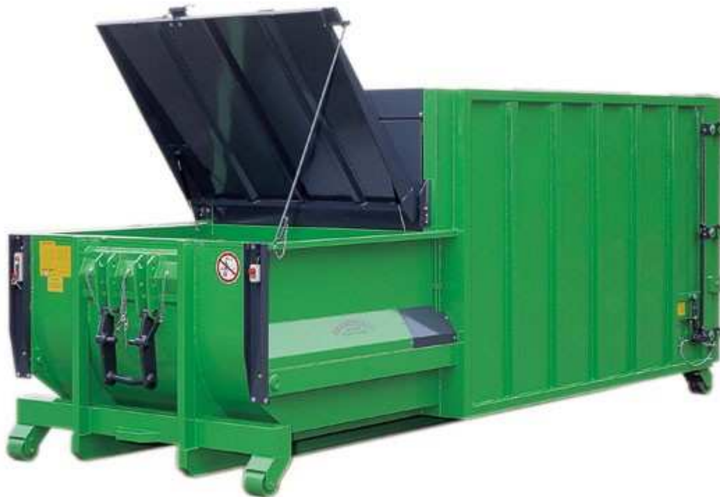
Mobil Hydraulisk komprimator med unikt självrensande inkast .