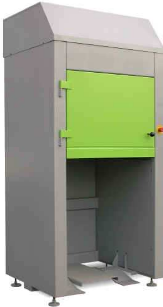
Kärlpress för 400 liters kärl

Kärlpress byggd för kontinuerlig användning inom bostadssektorn, handel och industri. Mycket lämplig för t.ex. brännbara restprodukter. Reducerar transportkostnaderna med upp till 75%.