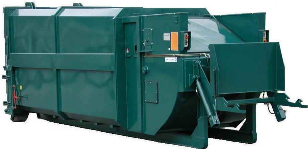
Vätsketät mobil komprimator med integrerad kärlvändare.

Hydraulisk mobil komprimator byggd för kontinuerlig användning inom handel och industri. Specialdesignad för vått material.